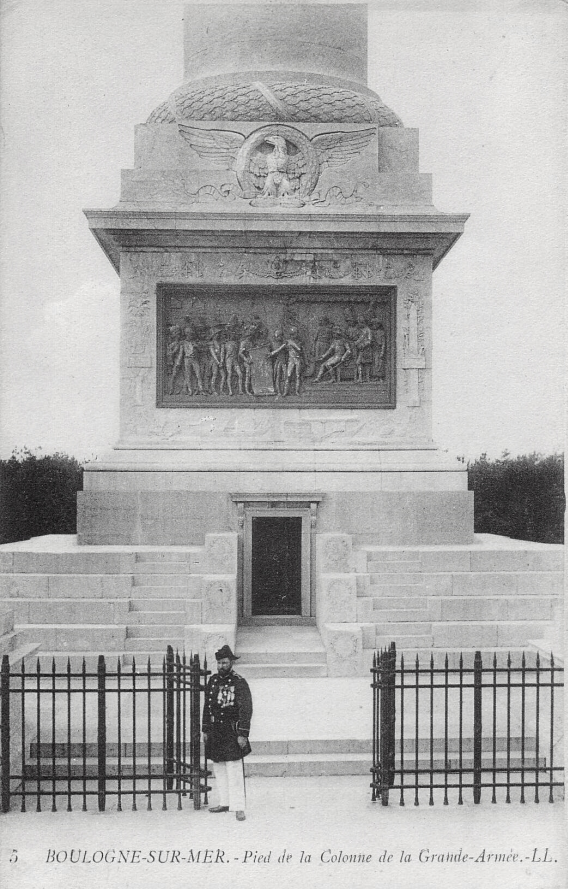
5 BOULOGNE-SUR-MER. - Pied de la Colonne de la Grande-Armée.

La première pierre du monument est posée le 9 novembre 1804, date symbolique du coup d'État du 18 Brumaire. L'inauguration a lieu le 15 août 1841, la distance entre ces 2 dates s'expliquant par l'histoire mouvementée du monument, sa construction étant menée au gré des circonstances politiques du moment.