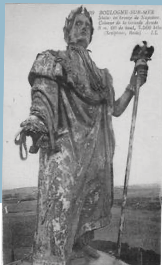
BOULOGNE-SUR-MER Statue en bronze de Napoléon Colonel de la Grande Armée H. m. 10 de haut, T. 500 lbs (Sculpteur, Bosio)

Elle fut ensuite transportée à Wimille et hissée sur la Colonne en remplacement du globe Fleur de lys.