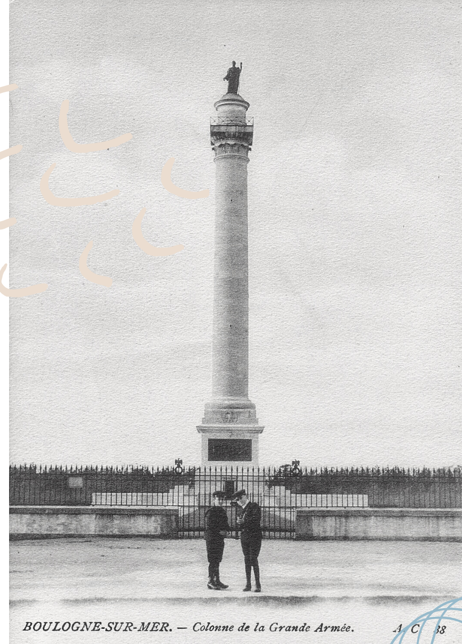
BOULOGNE-SUR-MER. — Colonne de la Grande Armée. A. C. 38